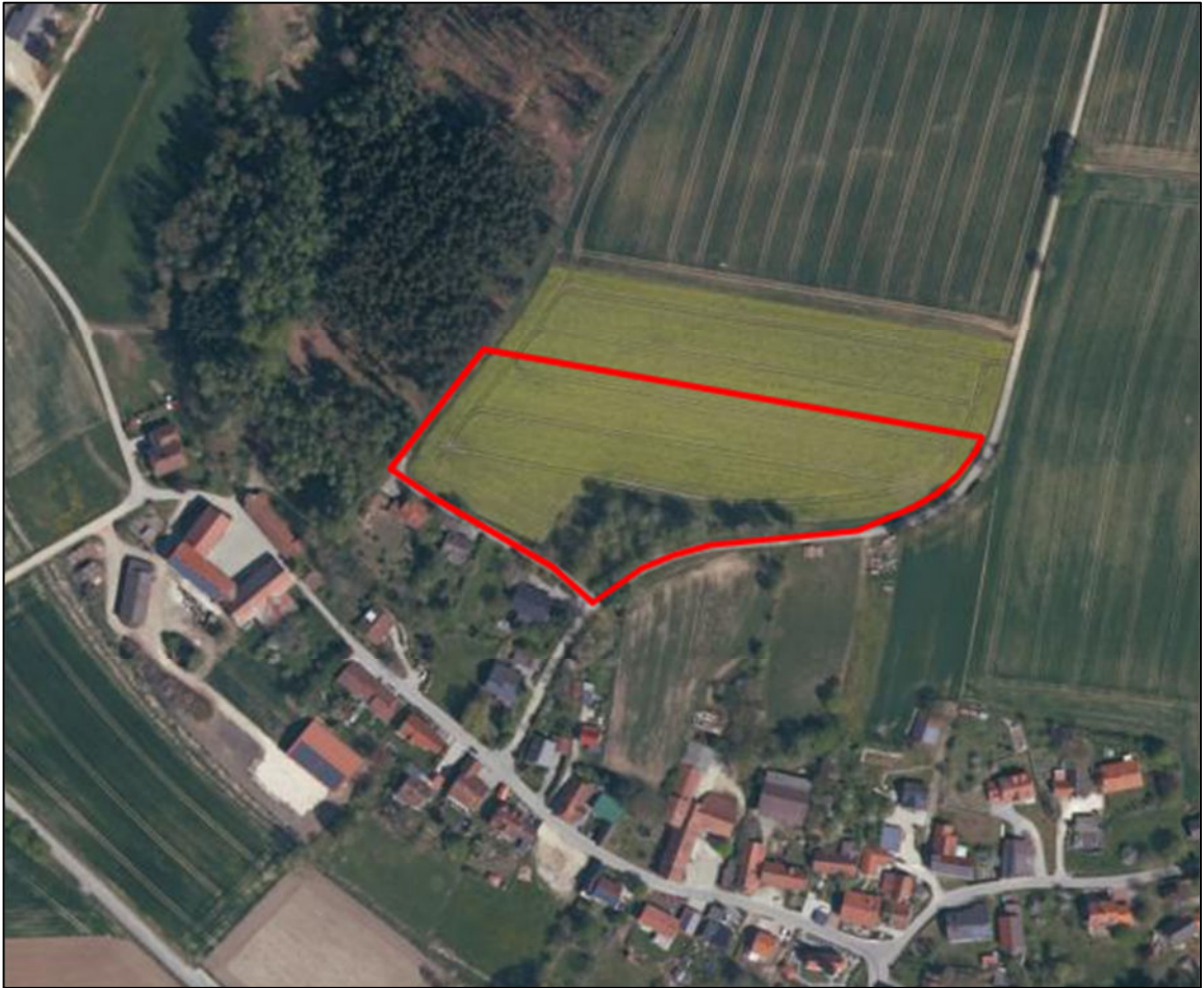
Abb. 1 Umgriff Bebauungsplan im Luftbild (rot, grob). Ohne Maßstab.